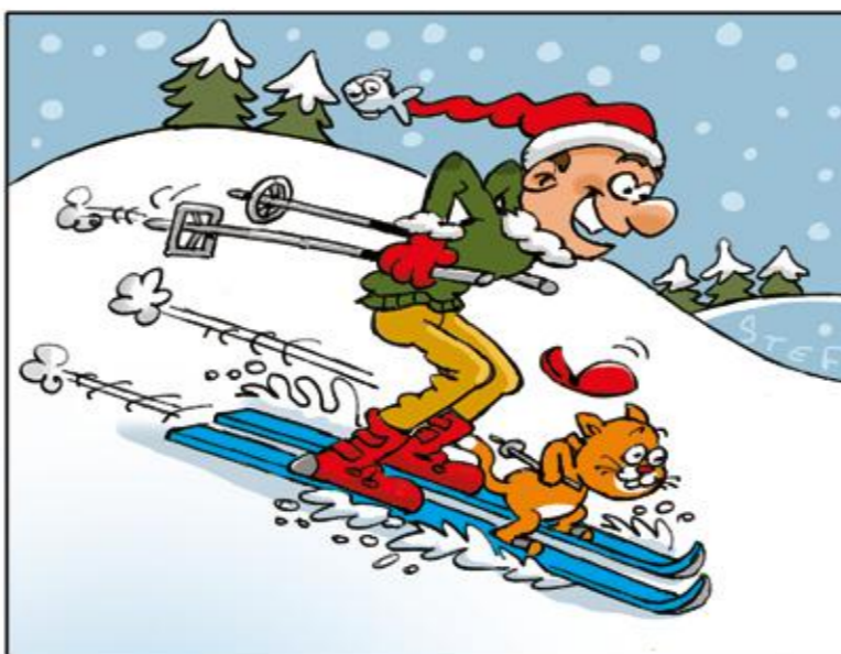
Zie jij de acht verschillen?