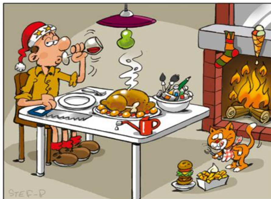
Zoek de negen fouten.