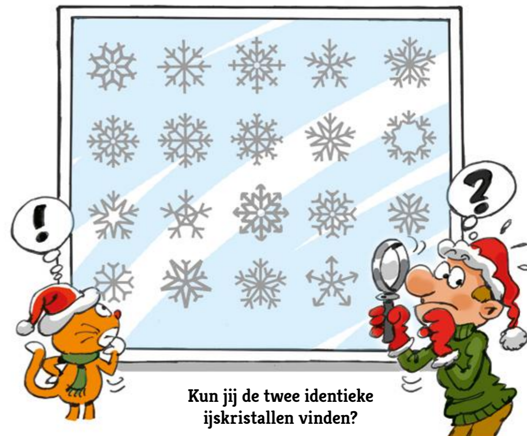
Kun jij de twee identieke ijskristallen vinden?